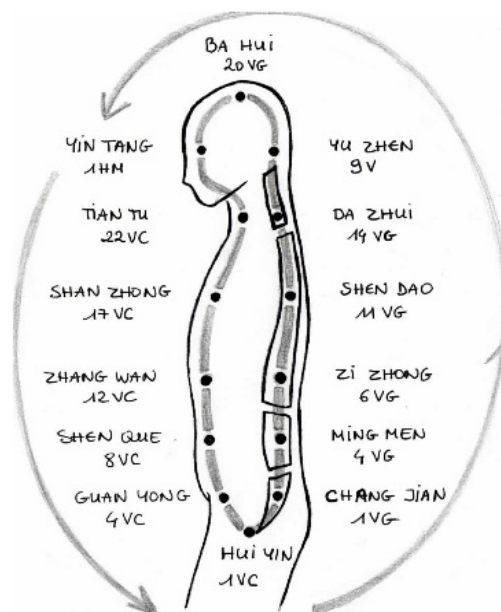
L'ORBITE MICROCOSMIQUE ou Petite Circulation Céleste.

Localisation : sur la ligne médiane de l'abdomen, à 2cun au-dessus du pubis.